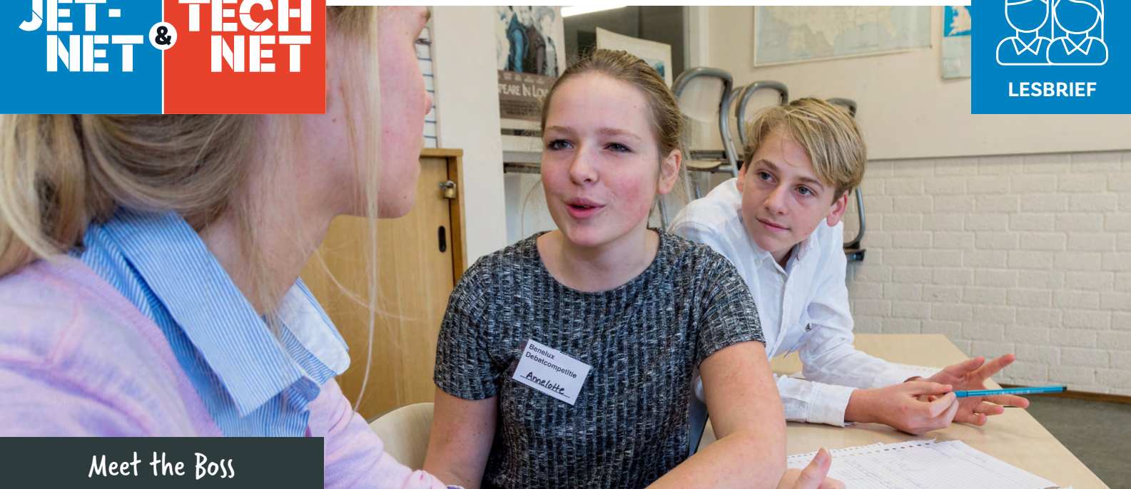
Meet the Boss