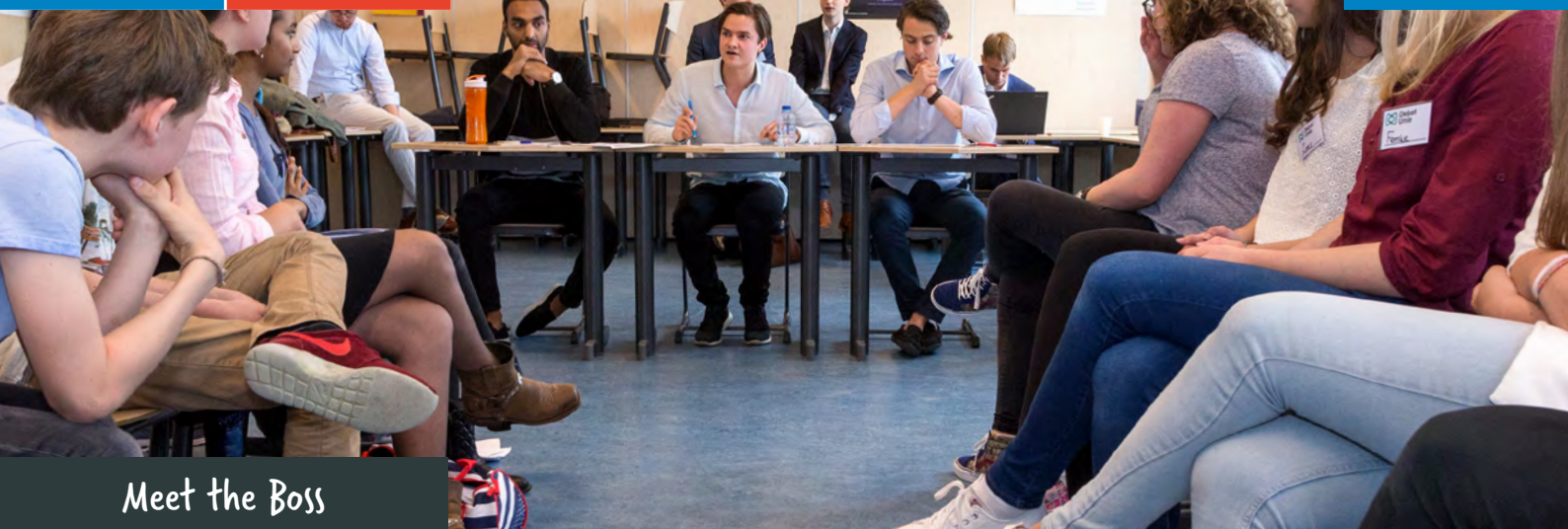
Meet the Boss